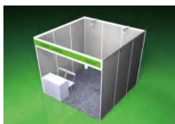
标准展位 3x3m (单开口)