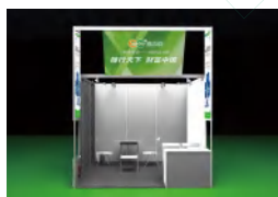
豪华展位 3x3m (单开口)