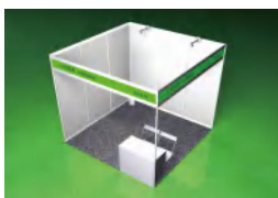
角标准展位 3x3m (双开口)