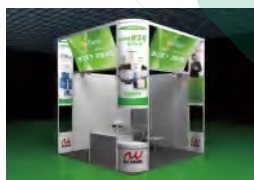
角豪华展位 3x3m (双开口)